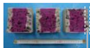
普通コンクリート